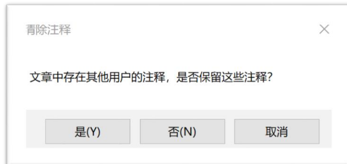
图六 清除注释界面

7、清除注释菜单可以根据需要，确定是否清除所有注释。如果只清除曾用格式帮检查产生的批注选是(Y)。(如图六)