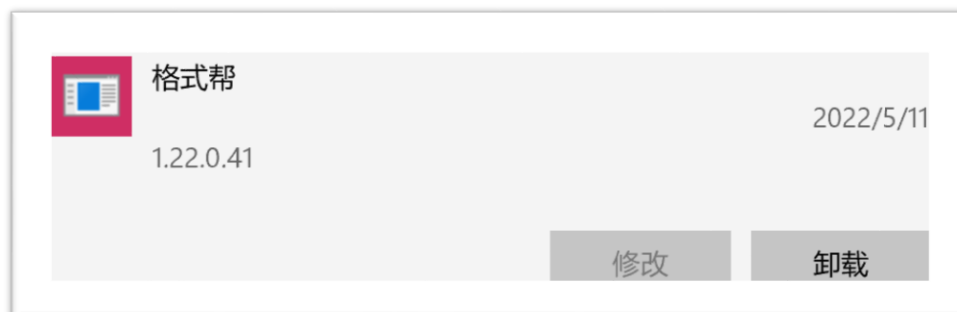
图七 程序卸载界面

在“添加或删除程序”中找到“格式帮”这个程序卸载即可（如图七）。如果需要重新安装该插件，同样需要先卸载再进行安装。